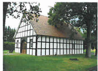
... im Heimathaus in Halverde