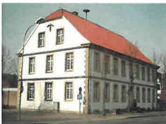
... im BürgerHaus Veerkamp in Hopsten