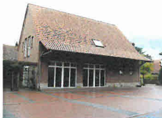
.....in der Evers'schen Mühle in Schale