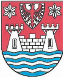
Lychen/Brandenburg seit 1991