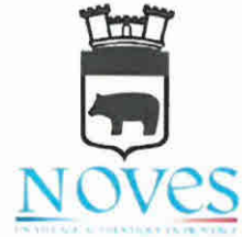
Noves/Südfrankreich seit 1988

Städtepartnerschaften leisten einen wichtigen Beitrag zu Frieden und Freundschaft in Europa. Sie helfen, Grenzen abzubauen und liefern einen idealen Rahmen, die internationale Zusammenarbeit zu pflegen. Gegenseitige freundschaftliche Besuche und Projekte verbinden die Menschen und gestatten dem Nachbarn einen unverfälschten Blick auf die eigene Art zu leben. Die Entdeckung fremder Kulturen ist immer eine Bereicherung des eigenen Lebens - insbesondere für die Jugend - und schlägt Brücken über die Landesgrenzen hinweg.